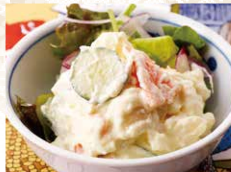
◆ 昔ながらのポテトサラダ 390円