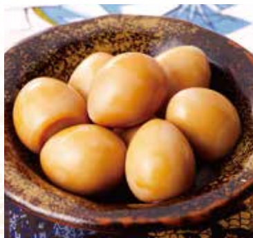
◆ うずらどんぐり 320円