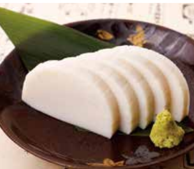
◆ 板わさ 320円