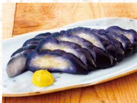
◆ 茄子一本漬け 450円