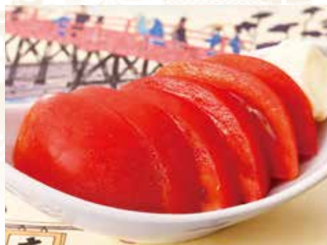
◆ 冷やしトマト 300円