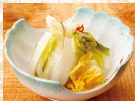
◆ 白菜漬け 220円