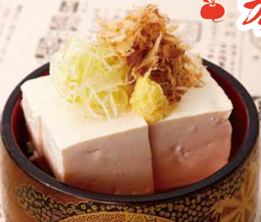
◆ 冷奴 300円