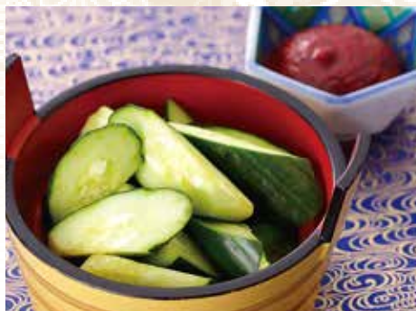
◆ 梅キュウ 350円