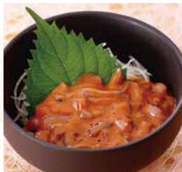
◆ いかの塩辛 480円