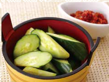
◆ モロキュウ 350円