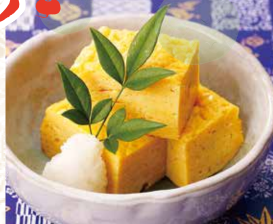
◆ 築地の厚焼玉子 350円