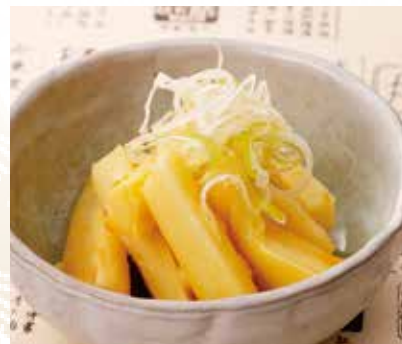
◆ 肉厚メンマ 320円